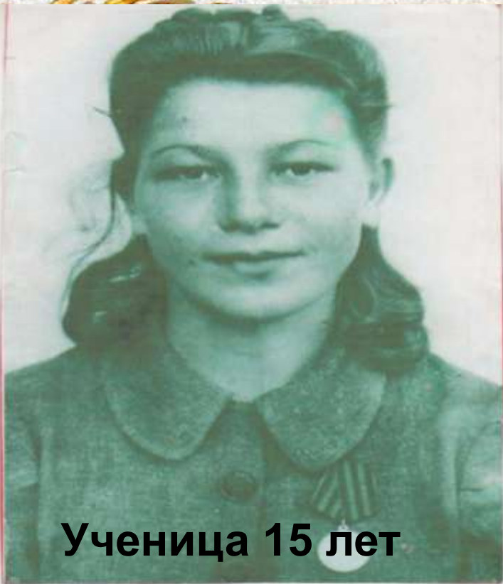
Ученица 15 лет